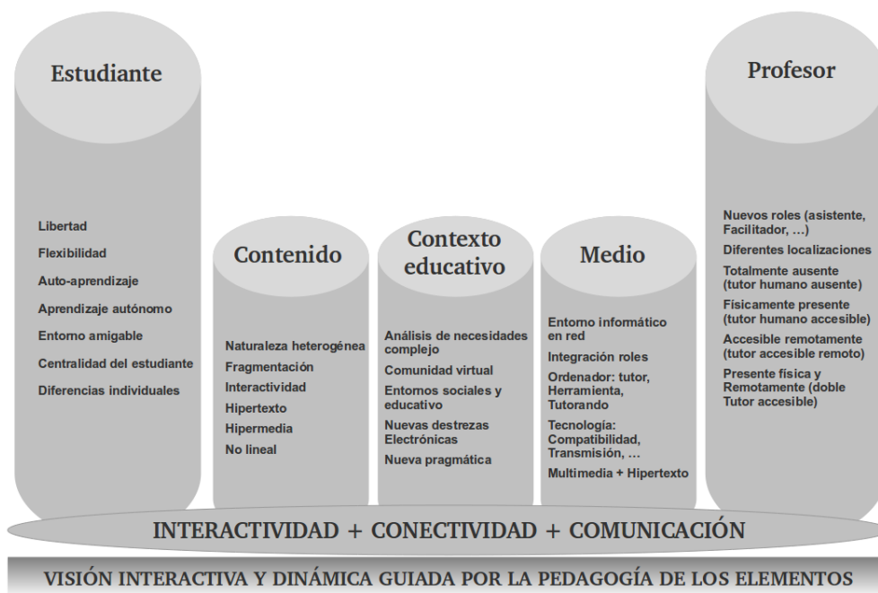
Figura 2: Componentes Activos del Proceso de Enseñanza/Aprendizaje de Idiomas en la Web